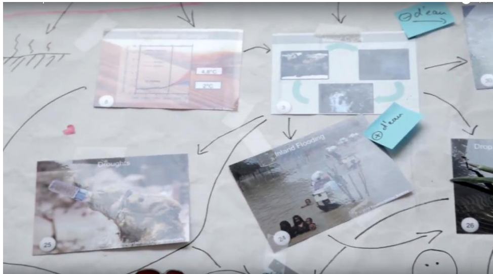
Fresque du climat en cours de réalisation