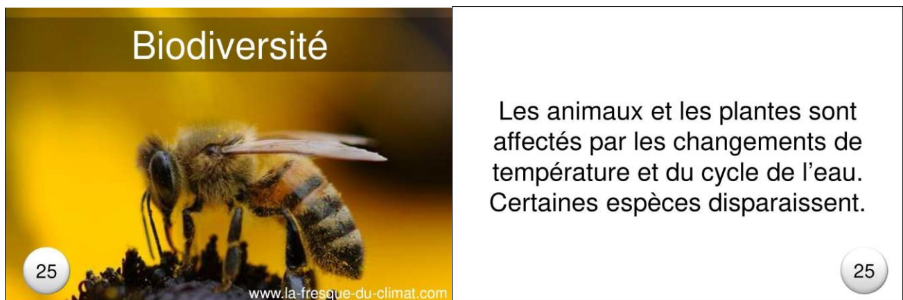
Carte n°25 recto - verso de la fresque du climat